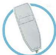
2つのボタンで 簡単操作