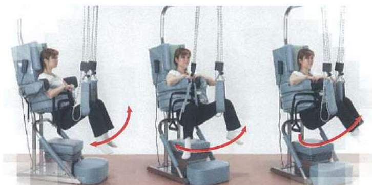
骨盤のうなずき運動 股関節の開排運動 腰椎・骨盤の回旋運動

本治療は、腰痛の原因となる上半身(全体重の約6割)を抱え腰椎患部を「免荷」。緩んだ腰椎に「骨盤以下の振り子運動」を加えることで、バランスを失った腰椎・骨盤がニュートラルに近づき筋スパズムと循環が改善。疼痛を減少させます。